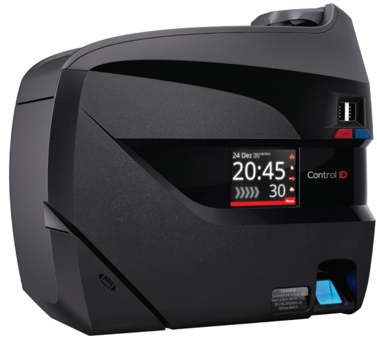
TABELA DE MODELOS